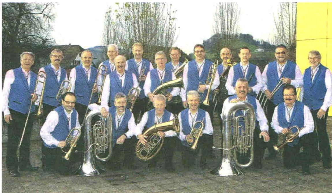
Die Burgrainmusikanten sind bereit für ihr Unterhaltungskonzert.

Bereits ab 18 Uhr können sich die Besucher mit Steaks oder Pastetli mit diversen Beilagen verpflegen. Platzreservierungen sind möglich im Internet unter www.burgrain-musikanten.ch oder per Tel. 041 984 10 10 bei der Raiffeisenbank Ettiswil.