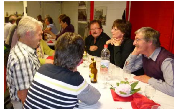
gute Stimmung hervorragende Bewirtung fröhliche Gesichter