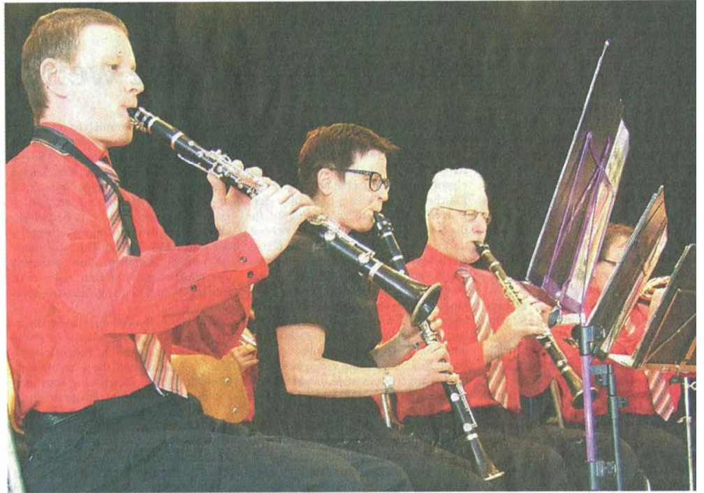
Lockerten die Delegiertenversammlung musikalisch auf: die «Burgrain-Musikanten».