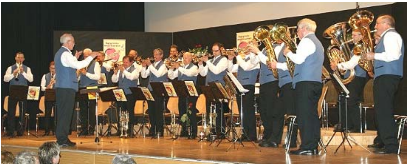
Die Burgrain-Musikanten in der neuen Bekleidung am Konzert vom 27.April 2013