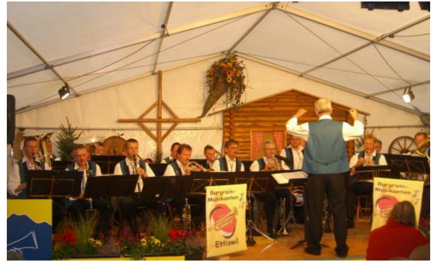
Unterhaltungskonzert in der Kaffeehütte

Mit einem Unterhaltungskonzert durften wir am Sonntag 29. Juni von 12'00 bis 14'00 h diesen schönen und eindrücklichen Anlass im Pavillon verschönern. Bei prachtvollem Wetter und vor einer gewaltigen Zuschauerkulisse bleibt dieser Anlass allen in bester Erinnerung.