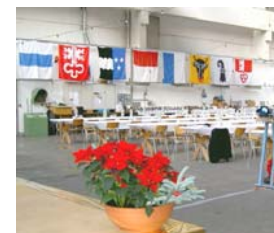
In der Panzerhalle durften wir den Jahresabschluss der Mitarbeiter musikalisch umrahmen.